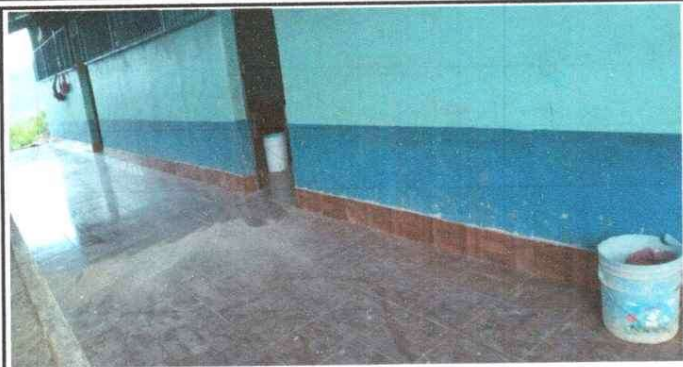
Foto1: VISTA CORREDOR FRONTAL.